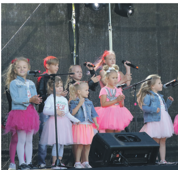
Детские коллективы на малой сцене.