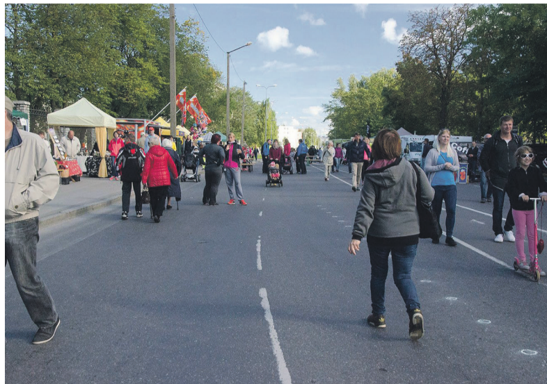
В 2016 году День без машин прошел на улице Паэ.

Дополнительная информация: тел. 616 4077, 640 4485, kommunaalamet@tallinnlv.ee