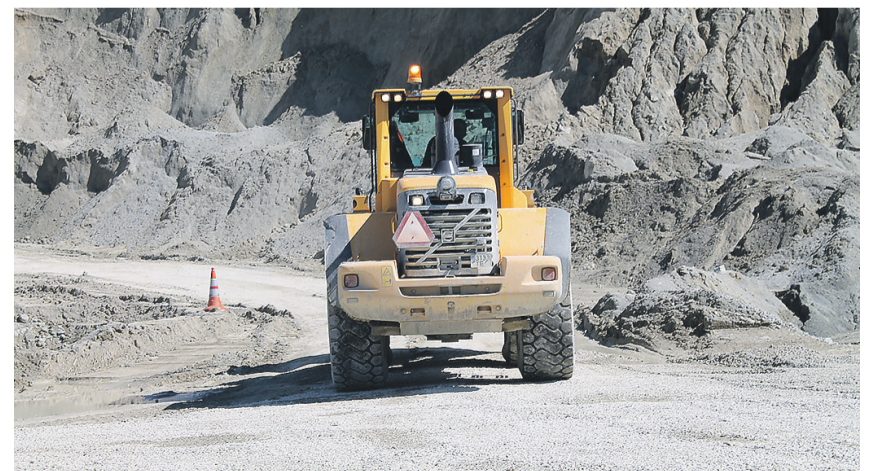
Основные работы по восстановлению земель запланированы на 2025–2027 г.

Рекультивация карьера Вяо идет полным ходом, часть территории засыпается твердыми материалами и землей, чтобы к концу арендного срока карьер можно было бы вернуть государству в первоначальном виде. Основные масштабные работы по восстановлению земель запланированы на 2025–2027 года, когда ресурс карьера иссякнет. Стоит отметить, что речь идет о первом в истории случае, когда арендатор вернет не просто заполненную водой яму, как это происходит