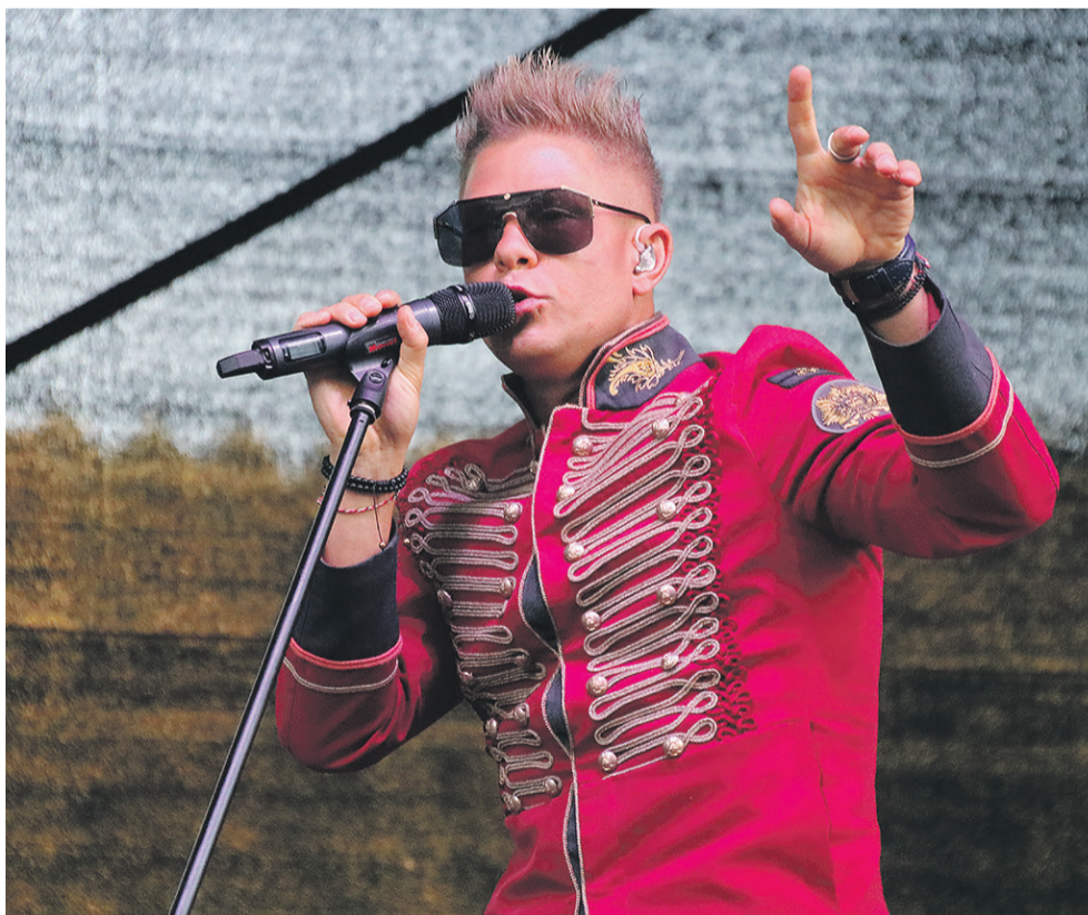
Главный исполнитель Митя Фомин.