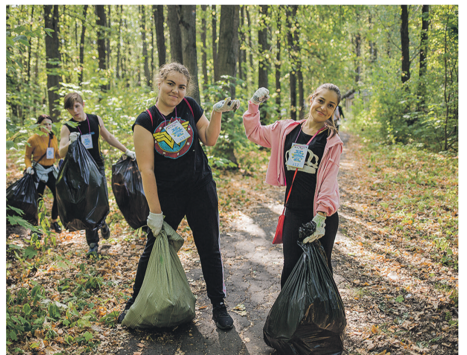
Игровой формат способствует повышению экологической грамотности участников.

Понравиться должна игра и технически продвинутым участникам – для получения дополнительных баллов можно делать отметки с фото очищенных мест. Во время игры используется мобильное приложение «Чистые Игры», с помощью которого можно видеть карту местности с отмеченным мусором и местами приема отходов, а также онлайн-рейтинг всех команд-участников.