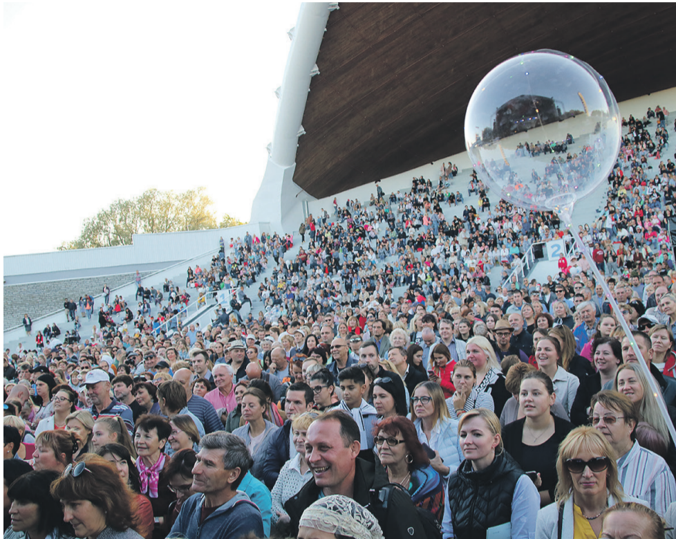
Гости Дня Ласнамяэ перед большой сценой мероприятия.

*Район Ласнамяэ с его нынешними границами был образован 1 сентября 1993 года.