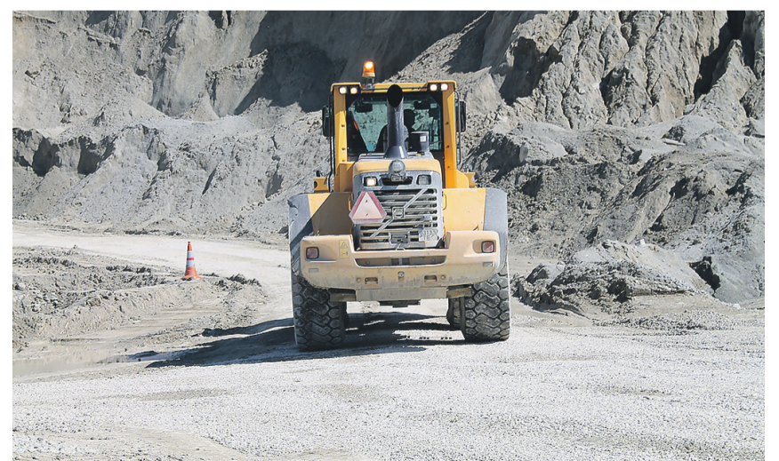
Peamised maaparandustööd on kavandatud aastateks 2025–2027.

Väo karjääri taastamine on täies hoos, osa territooriumist on juba kaetud tahke materjali ja kasvupinnasega, et see rendiperioodi lõpuks riigile algsel kujul tagastada. Peamised suuremahulised maaparandustööd on kavandatud aastateks 2025–2027, kui karjääri ressursid otsa saavad. Vääril märkimist, et tegemist on ajaloos esimese juhtumiga, kus üürnik ei tagasta tühjaks kaevatud ja veega täitunud karjääri, nagu see sageli