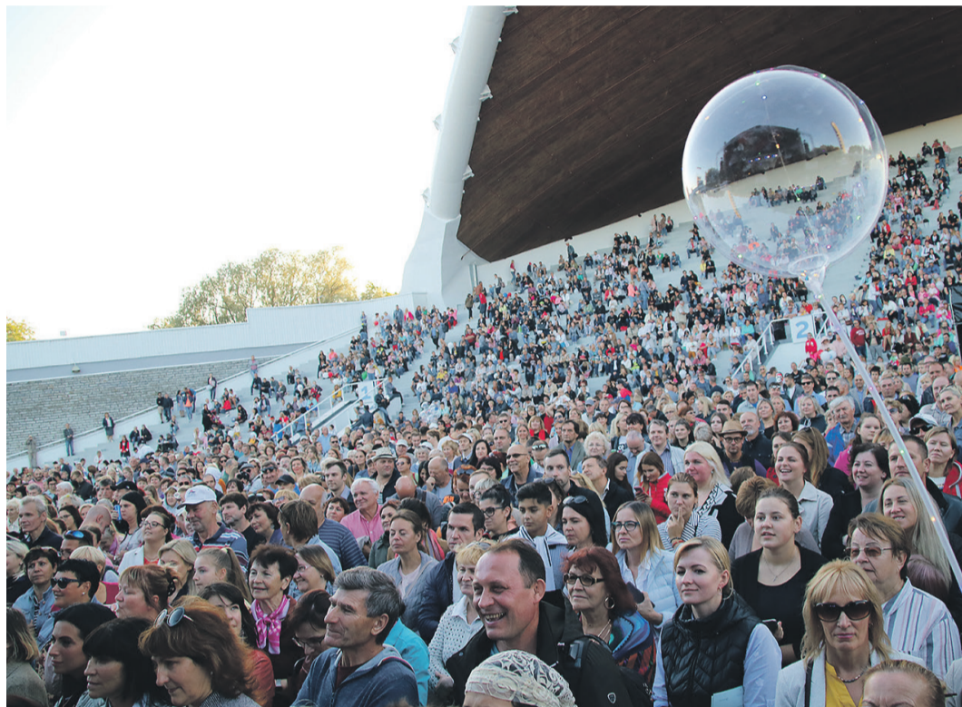
Lasnamäe päeva publik esinejatele kaasa elamas.