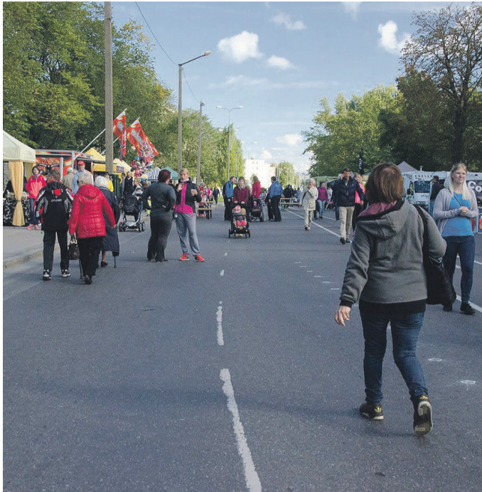
2016. aastal toimus autovaba päev Pae tänaval.