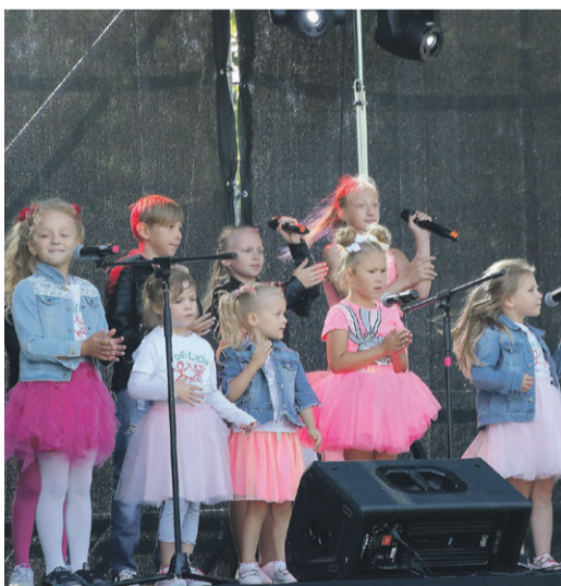
Laste laulu- ja tantsuansamblid väikesel laval.

* Praeguste piiridega Lasnamäe linnaosa loodi 1. septembril 1993.