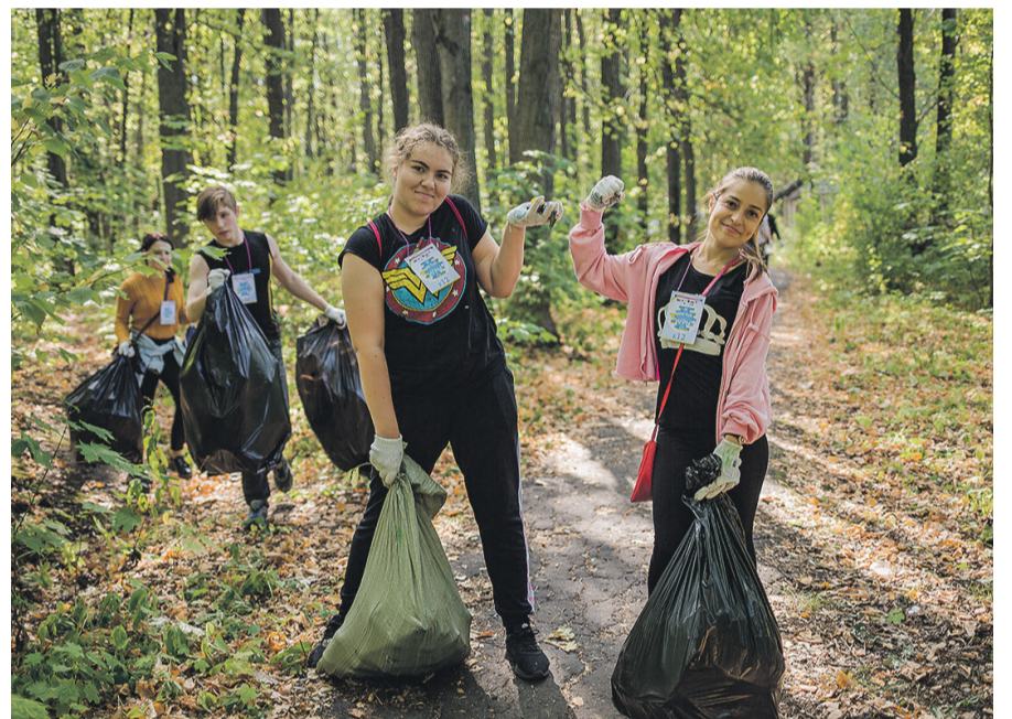
Mänguformaad suurendab osalejate keskkonnateadlikkust.

kasutada Clean Games'i nimeelist mobiiliäppi. Äpis on leitav nii ala kaart märgistatud prügi asukohtade ja jäätmejaamadega kui ka kõigi meeskondade online -pingerida.