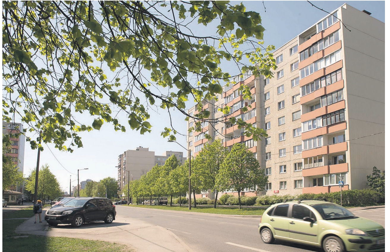
Investeering Lasnamäe korterisse tasub end ära 13-15 aastaga.

Kinnisvara hindu mõjutavad kindlad kriteeriumid. Nende hulka kuuluvad maja või korteri asukoht, pindala, korrus. Need on põhiparameetrid, mille abil