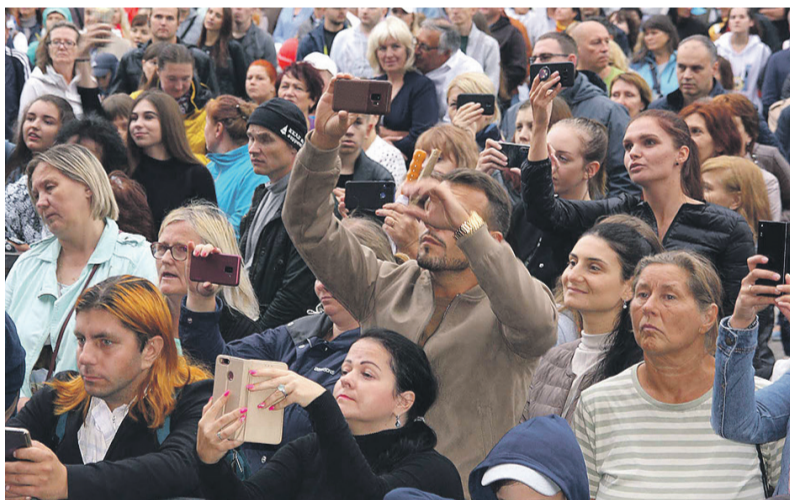
Lava ees oli huvilistel võimalus jäädvustada oma lemmikuid.