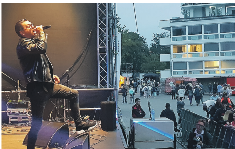
Juubelipidustuste peaesineja Belgia tantsumuusik Danzel.

Seekord pani korraldustoimkond erilisel rõhku ka kohapeal teavitamisele, kaasates Lasnamäe päeva läbiviimisse vabataht-